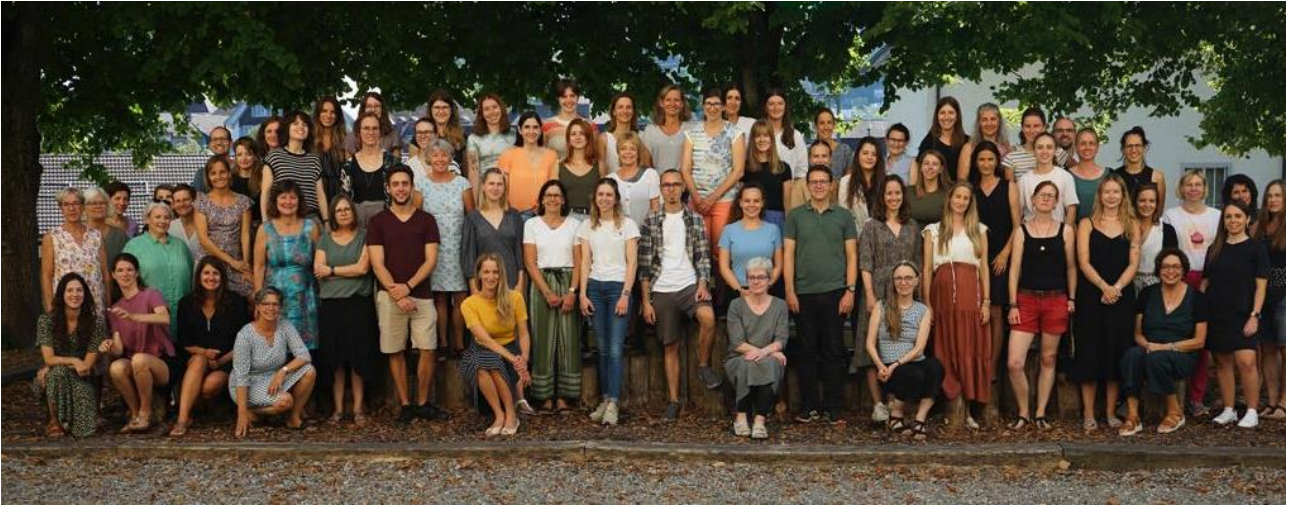
Team Angelrain Schuljahr 23/24