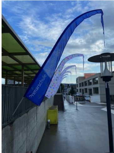
Neue Willkommensflaggen Pausenplatz